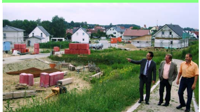
Baugebiet Langenbruck Ost - Südhang -