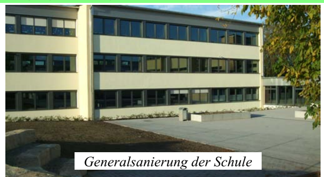
Generalsanierung der Schule