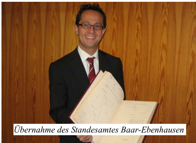
Übernahme des Standesamtes Baar-Ebenhausen