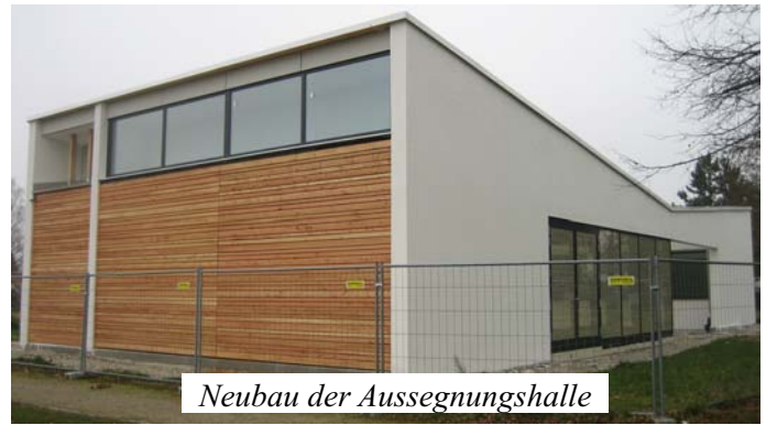
Neubau der Aussegnungshalle