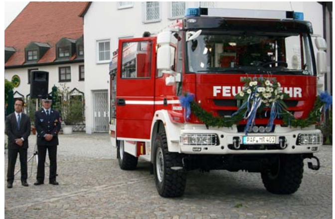
Eines von insgesamt 4 neuen Feuerwehrfahrzeugen