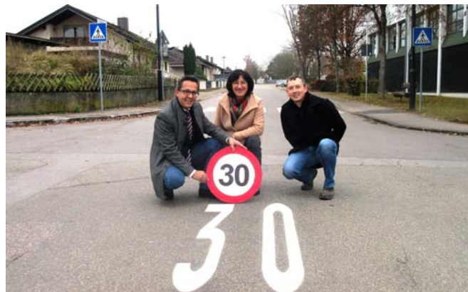
Einführung 30 km/h in allen Wohngebieten