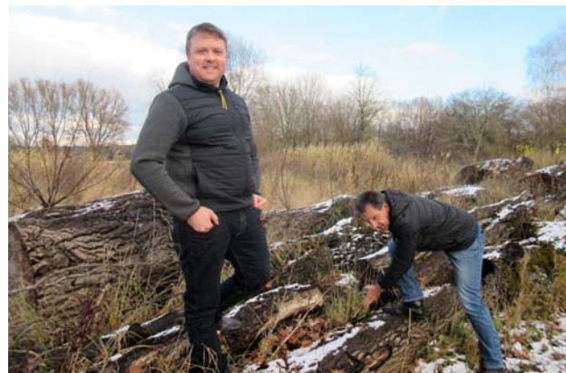
Totholz- und Blühflächen auf öffentlichen Grundstücken zur Förderung der Artenvielfalt.