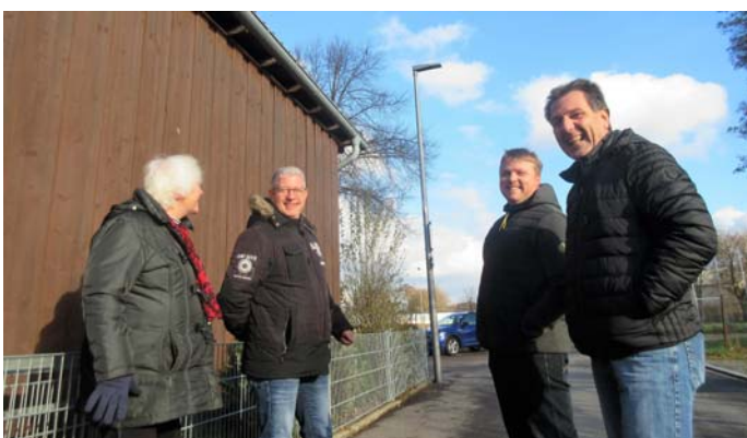
Straßenbeleuchtung zukünftig stets insektenfreundlich