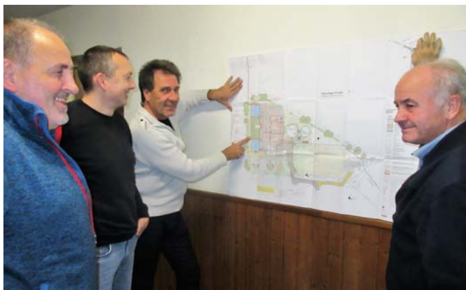
Größtes Umweltschutzprojekt: Neubau Kläranlage Winden mit Anschluss Hög & Ronnweg, Stauraumkanäle, Kanalsanierung & Phosphatfällung zum Gewässerschutz.