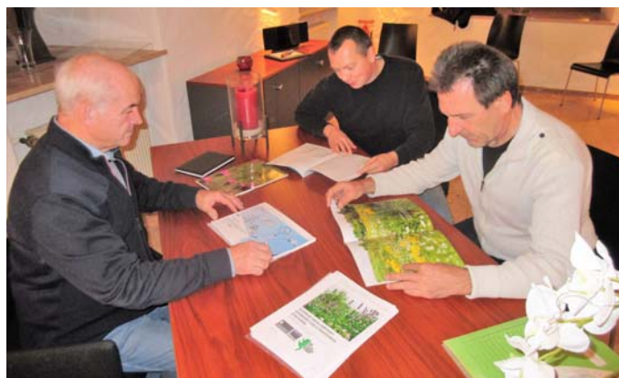
Gründach- & Photovoltaikpflicht im neuen Gewerbegebiet; naturnahe Gestaltung öffentlicher Flächen, Anreizsystem zur naturnahen Gestaltung der Betriebsflächen.